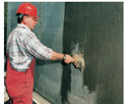
PCI Barraseal ist plastisch-geschmeidig. Poren und Vertiefungen werden leicht und schnell geschlossen.