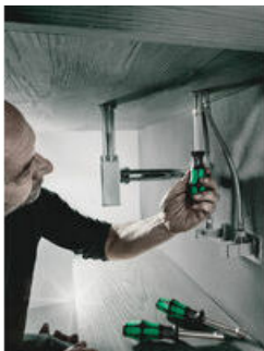
Holle Schacht voor lange draadeinde