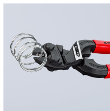
Krachtig tot in de punten