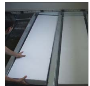
Aanbrengen EPS isolatie