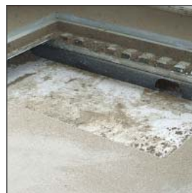
Zwaluwstaartplaat met zandcement