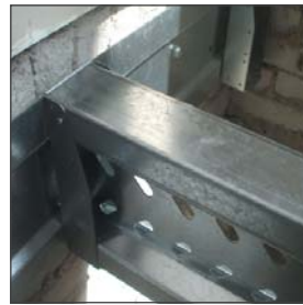
Muurprofiel met haakbeugel

Voor meer vloerdetails, raadpleeg het Combifor verwerkingsvoorschrift.