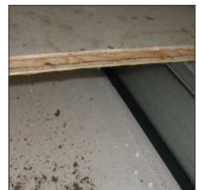
Underlayment op Combifor ligger