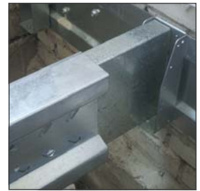
Muurprofiel, ligger en schuif-koppelstuk