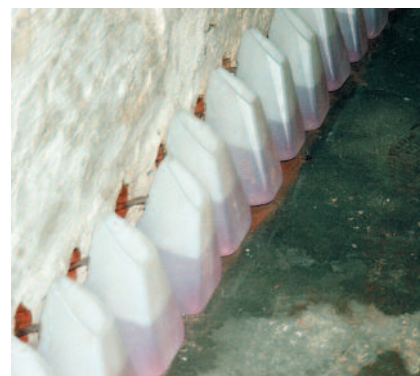
PCI Bohrlochsperr wordt minimaal 24 uur door middel van vloeistofhouders PCI Injektionsbehälter geïnjecteerd.